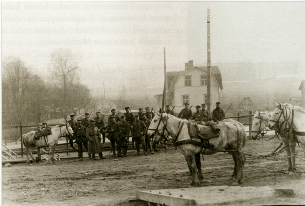
Saksalaisia sotilaita lepotauolla voittoisan taistelun jälkeen Leppävaaran asemalla.

Kasimir Leinoa ehkä ajateltiin silloin kun eräälle Leppävaaran kujalle annettiin nimi KASIMIRINKUJA. Erittäin hieno ja kaunis nimi, mutta väärässä paikassa. Uuteen asemakaavaan, jonka alueella on paljon historiallisia nimiä, olisi Kasimir-alkuiselle tiennimelle löytynyt varmasti oivallinen kohde hänen asuinpaikkansa läheltä. Paikka olisi voinut olla vaikka PANORAMA-CENTER-talon vieressä.