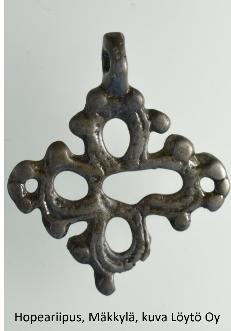
Hopeariipus, Mäkkylä