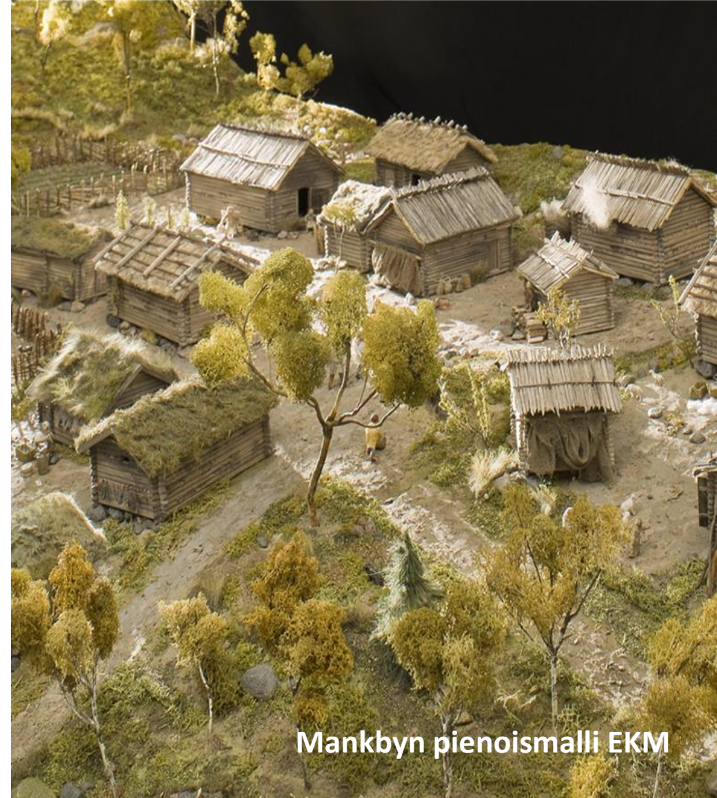
Mankbyn pienoismalli EKM