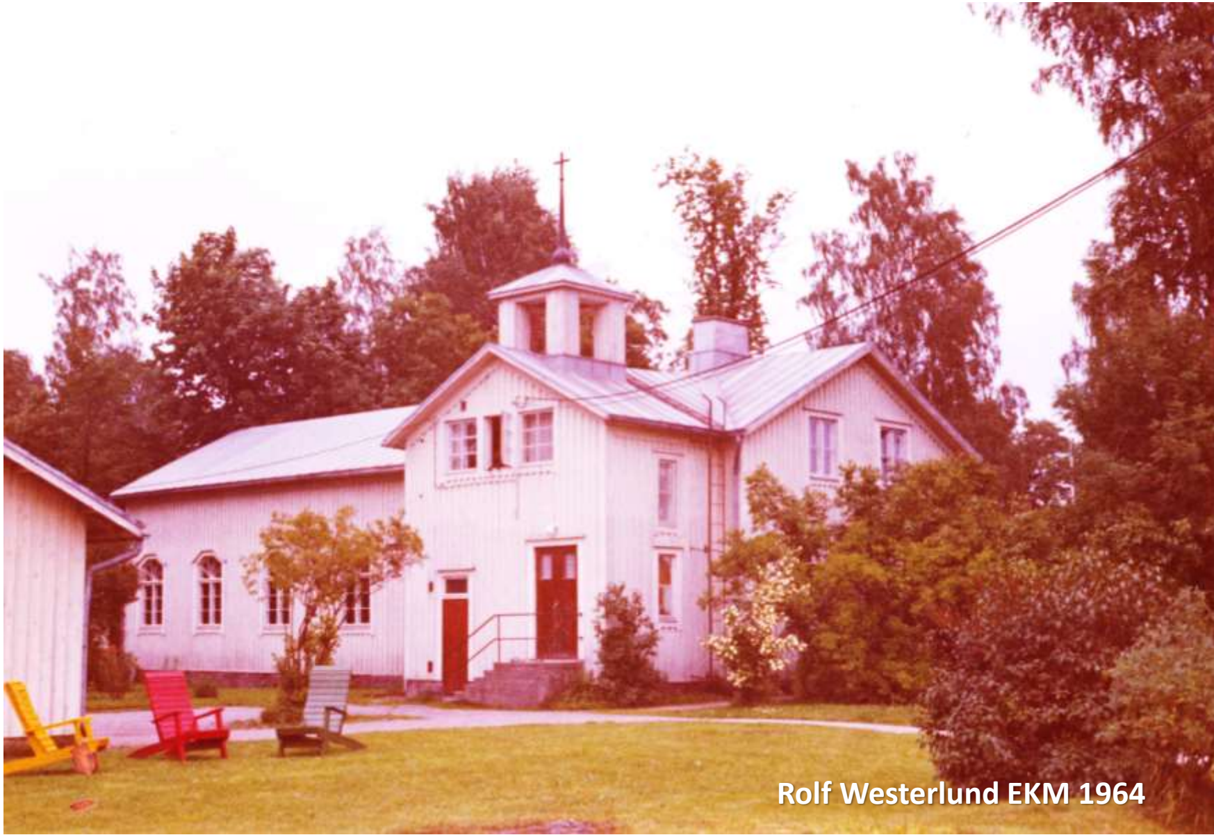
Rolf Westerlund EKM 1964