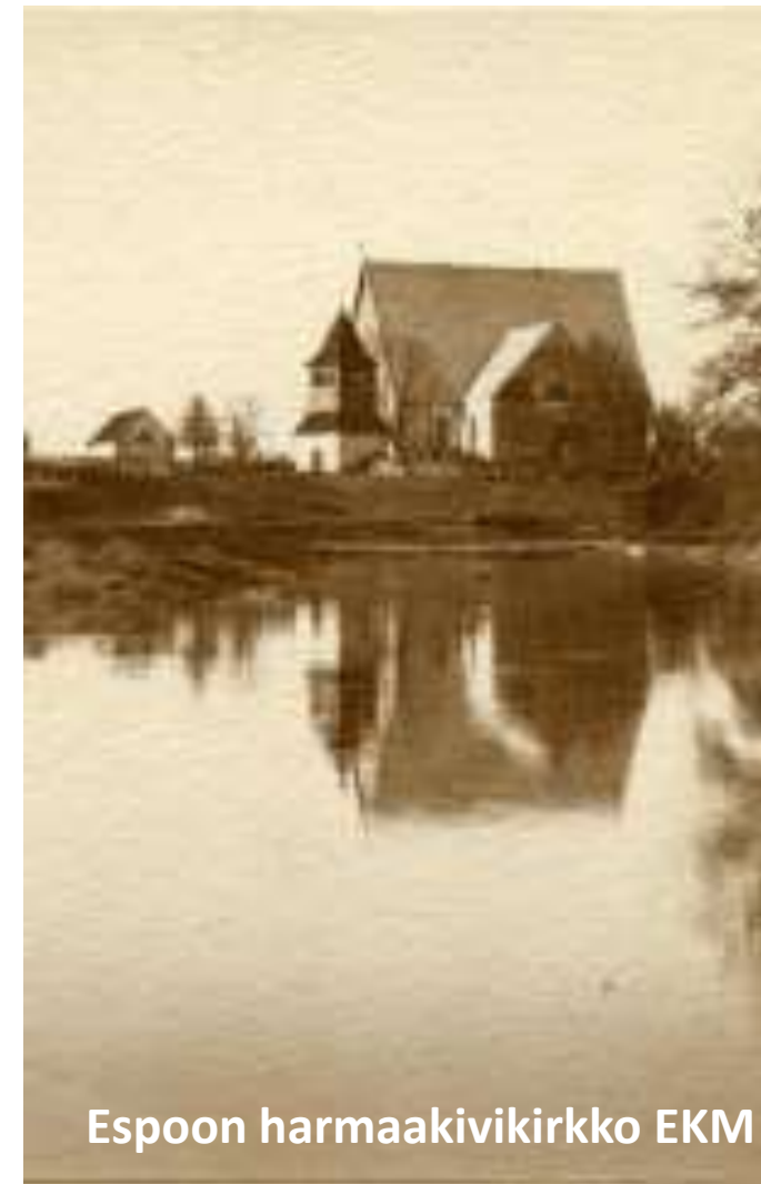
Espoon harmaakivikirkko EKM