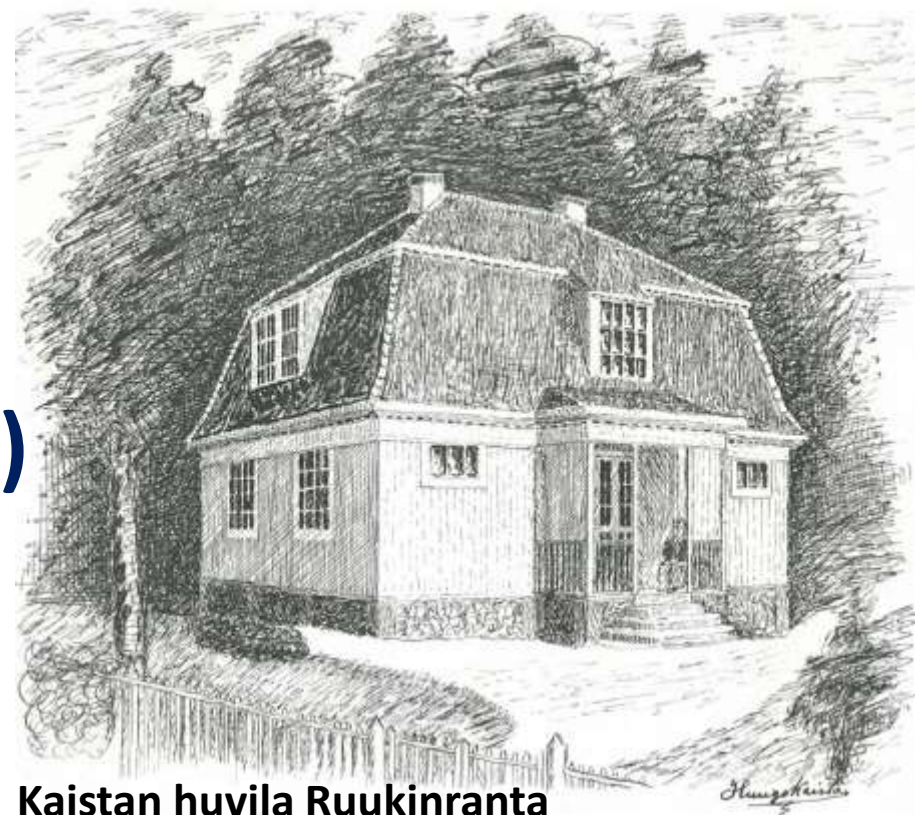
Kaistan huvila Ruukinranta