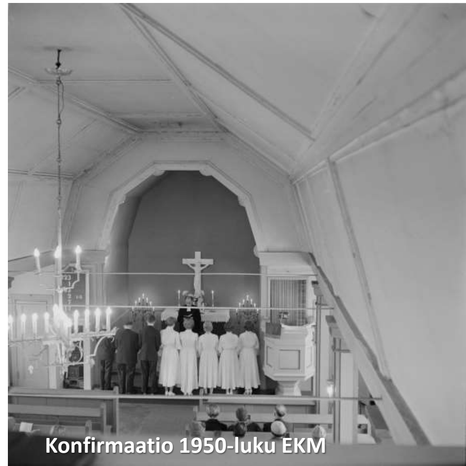
Konfirmaatio 1950-luku EKM