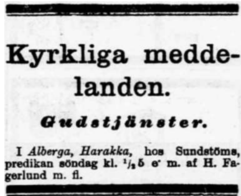
Nya Pressen 27.6.1908