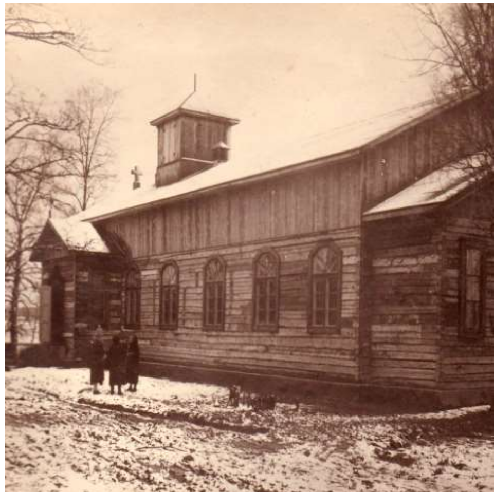
Leppävaaran pikkukirkko, EKM